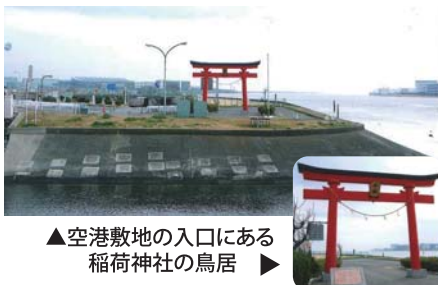
▲空港敷地の入口にある稲荷神社の鳥居

私はたまたまテレビ会社のディレクターをしていたので、仕事で取材に行くという恵まれた環境だった。そんな時代だったので航空会社の操縦士やスチュワードも花形の職業で、東京都内のホテルに宿を取り、ホテルから迎える車で羽田空港にやってくるのが当たり前だった。当時の羽田空港は今から考えられないくらい狭い空港で、鉄