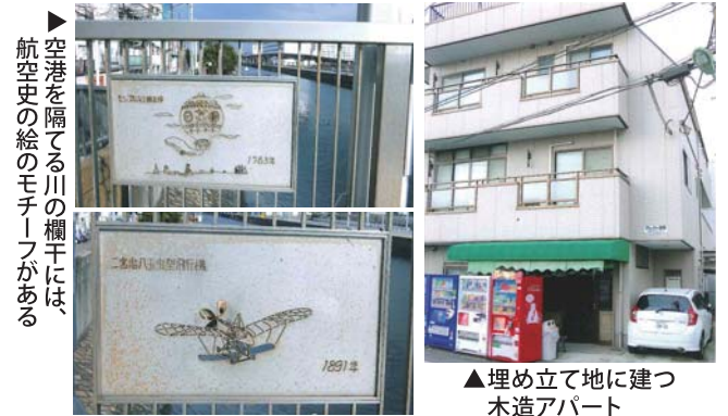
▲埋め立て地に建つ木造アパート