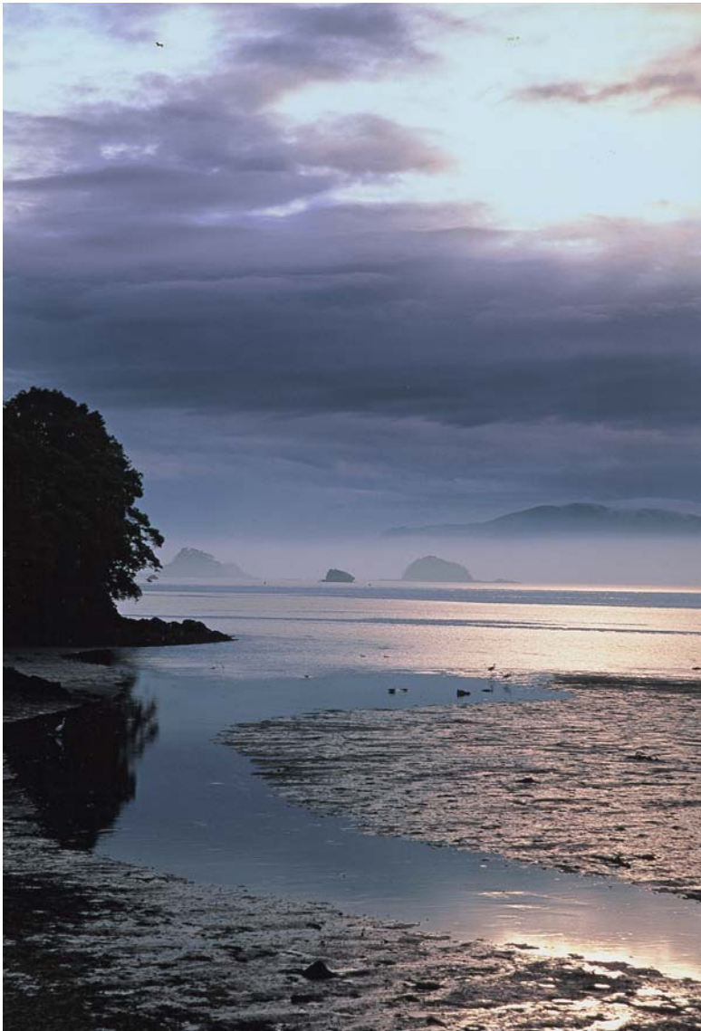
(撮影場所: 芦北町計石)