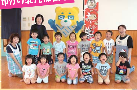
ゆかり乳児保育園