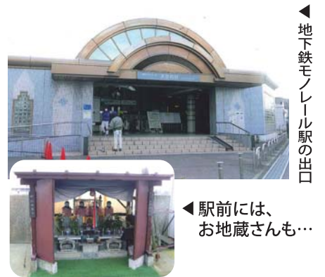
▲地下鉄モノレール駅の出口