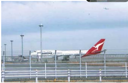
▲フェンスのすぐ向う側に飛行機が見える