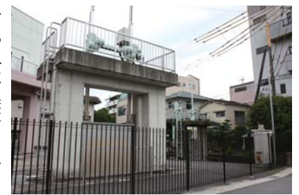
▲かつての野上にある野上ポンプ場

けくらべでんしようかい。明日の朝、《萩原堤》まで来なつせ。おサムライひとりなんて易しかけん、オイラは殿さんの行列にでん化けてみせるばい」 さてその次の日、ベツピンぎつねは《萩原堤》の松の上ののぼつて、彦一が来るのを、今か今かと待っていました。すると、たしかに城下町のほうから立派な行列がやって来るではありませんか。 「あら〜、むしやんヨカー！ コンな立派な行列に化けらるつてね〜！」 とカンゲキしたベツピンぎつね、いきおいあまつて行列の前に飛びおりました。 「彦一ちゃん！ すごかー！」 おどろいたのはおサムライたち、 「ムムムッ！ あやしかキツネめ、ひつとらえる！」 「アカーン、彦一ちゃん！ アタシたい、アタシ、ベツピンぎつねたい！」 ベツピンぎつねは、いっしょうけんめい、うったえました。つがまり、すつかり、こらしめ