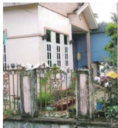
▲郊外の高級住宅 高級住宅街では番犬の姿も...