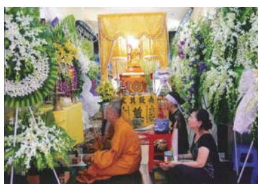
▲お寺でお祈りをする人達