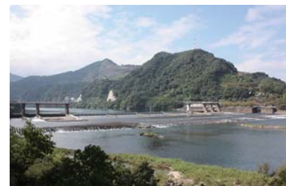
▲カッパの目撃情報もある遥拝堰

「彦一、悪かった」と殿さま、次のえさをちぎって彦一に渡します。だまって、目をつぶって。彦一は針につけたふりをしてびくに入れて、チャポン。それからしばらくすると、待ちきれず殿さま、「ひこいち、まだかい?」「あーいた、殿さま。今か