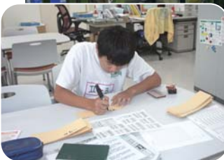
◀事務仕事の手伝い