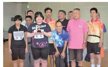
▲県内各地から集まった参加者