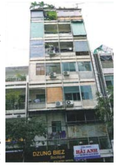
街中にはエアコン付きの住宅も...