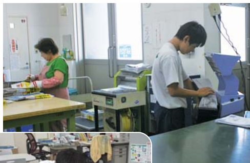
▲翌日朝刊の折込チラシの準備

仕事の大変さを忘れず親に感謝して、高校に進学し「学んだことを活かしていきたいです」