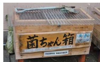
▲園庭に設置された「菌ちゃん箱」

さる6月25日、八代地域盲人卓球愛好会主催の「平成29年度球磨川杯争奪サウンドテーブルテニス大会」が、西松江城町の八代市総合福祉センターで開催され、県内の選手12名が出場し、真剣勝負を繰り広げた。