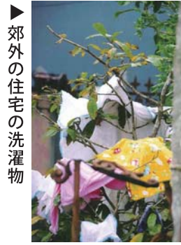
▲郊外の住宅の洗濯物

ごしている人もたくさんいる。アジアの国ということ、ヨーロッパの富裕層が憧れてやってくる国なので、街の中心街には高級ブランドの店の軒を並べ、世界中の食べ物が集まっている。