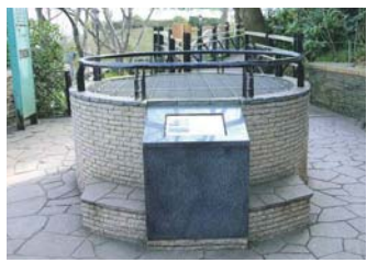
▲保存してある井戸の遺構