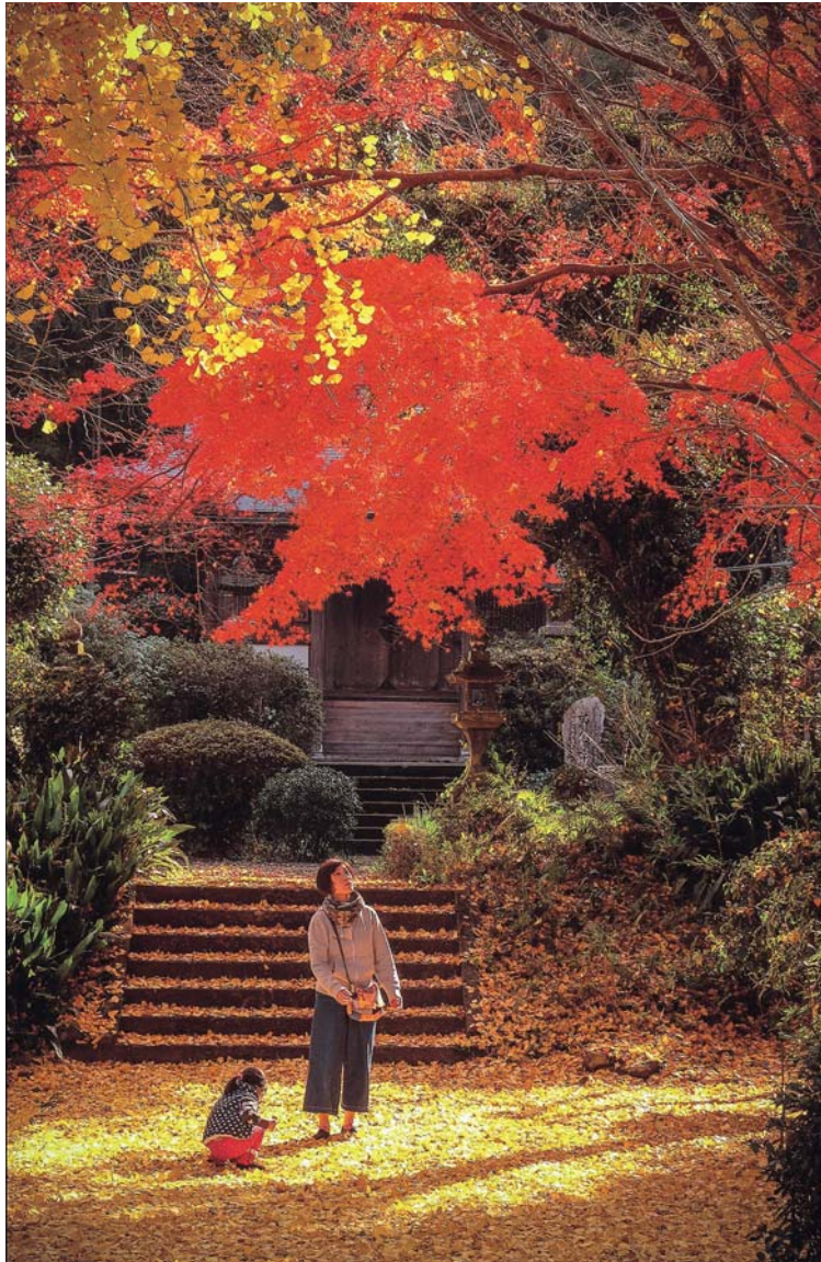
〈写真〉宮村 信子 (撮影場所:宮地町)