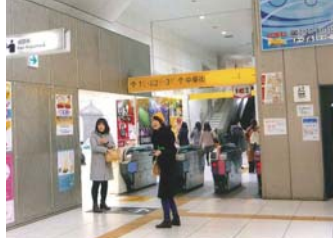
▲今や、地下鉄で中華街へ…

港の見える丘公園一帯は高台になっていて、その昔は海が見えて来るといって高級住宅地。今回は海は見えなかったが、汽笛は聞こえ自然環境は大変よい場所。しかし、昔は高台だったので上下水道は整備されておらず、住民のために飲み水を確保せねばならず、井戸を掘り、その動力として風車としてポンプを動かしていたというからすごい。海辺などで風が吹くという条件をうまく利用したものだ。