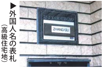
▶外国人名の表札 (高級住宅地)