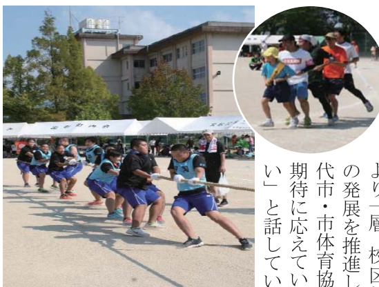
校区民体育祭の様子