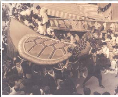
亀蛇の宮参り (昭和29年)