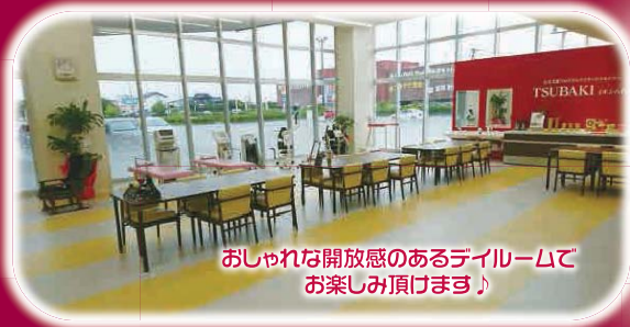
おしゃれな開放感のあるダイニングで お楽しみ頂けます♪