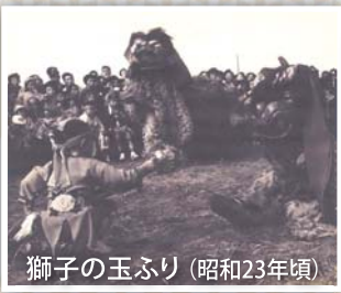
獅子の玉ふり (昭和23年頃)