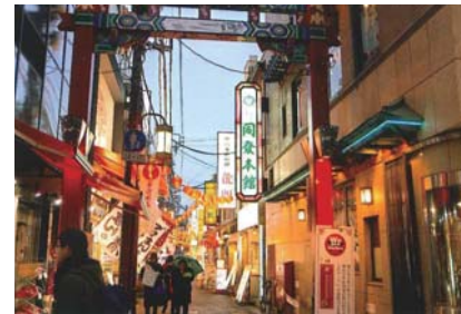
▲以前に比べ道幅も広く、照明も華やかなチヤイナタウン(中華街)

○ワンポイント 「電気は常に家の中を流れ、湿気やほこりに弱く発熱します。正しい取り扱いと点検が必要なのです!」 電気の現象や法則は変えられないものです。理解して正しく使用しましょう!