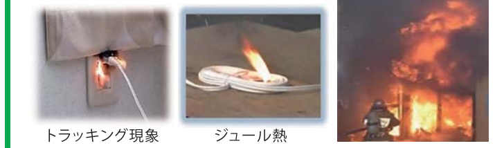
トラッキング現象

電気! だから安全? 電気は便利で安全なものとして、社会の様々な役割の中で欠かせないクリーンエネルギーです。しかし、管理や取り扱いによっては火災の危険が潜んでいるのです。