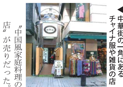
◀ 中華街の一角にあるチヤイナ服や雑貨の店

つと見つけた1軒の店は「お1人でもどうぞ」という店だったが、なんとその店は中華料理の一杯めし屋という感じで、好きなものを1皿ずつ取る和食屋さん。そこは 「中国風家庭料理の店」が売りだった。間口が狭く、うっかりすると通り越してしまいそうな店だったが、料理は素朴な味でおいしかった。