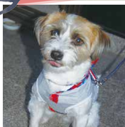
ジャックくん (2歳・オス) ★ジャックラッセルテリアとシーズーのMIX 苗床 美津子さん(築添町)