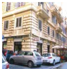
▲ローマ市内は高層ビルはなく、1、2階が飲食店、3階以上はほとんどがホテル

ティモンゴレー、スパゲッティポロネーズなど、日本の食堂で出てくるメニューと全く同じで、本場のスパゲッティを食べねばとそれを注文すると、違うところがチーズがやたらとかかっていること。実は私はチーズが苦手なので初めは少々避けたのですが、こればかりはどうにもならず、チーズの香りが体に染みついて帰ってきました。そうイタリアはワインの名所、ワインも色々と味わってきました。