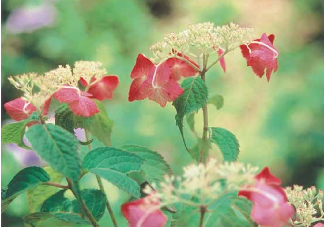
〈写真〉佐土原 佐代子 (撮影場所：八代宮のあじさい)