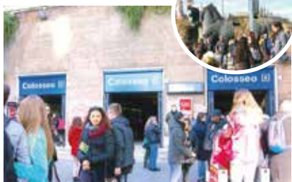
▲ローマ市内に地下鉄が走りコロッセオにも地下鉄で行ける

RKKラジオ「こちら九州ラジオ村」毎週月曜日 19:30~20:10 好評放送中!