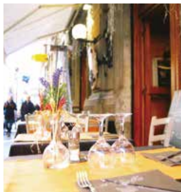
▲ローマ市内のオープンカフェのテーブル

と、それをおいしさにもりもり食べ、5日間で丸々と太りました。 観光は全て歩きなので、のどが渇くとホテルのコーヒーマシーンに入ってコーヒーを飲み、イタリア人はパスタを前菜として食べるのですが、今や他国の人が来るようになってスパゲッ