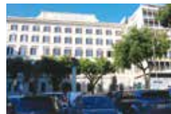
▲ローマ市内の最高級ホテルグランドホテル

り、あまりのおいしさにもりもり食べ、5日間で丸々と太りました。 観光は全て歩きなので、のどが渇くとホテルのコーヒーマシーンに入ってコーヒーを飲み、イタリア人はパスタを前菜として食べるのですが、今や他国の人が来るようになってスパゲッ