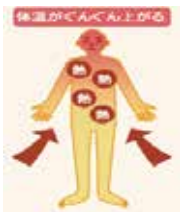
気温が高く、湿度が高い