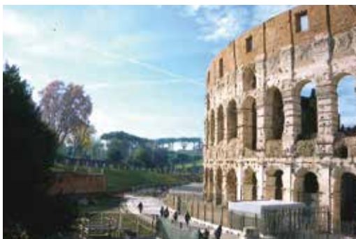
▲ローマの観光名所コロッセオ(昔の大浴場)

ヨーロッパでは「メイストーム」(五月の嵐)と言って、台風に襲われるシーズンです。私が行ったのは3月の初めでしたが、朝夕は寒く、気温は2度、日中でも12、13度にしか上がらないという状態でした。