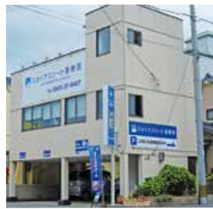
スカイアスリート接骨院

超音波(エコー)検査・物理療法はもちろん、身体の歪みや怪我の後の拘縮などにより本来の力が出せなくなった体を操体法で整えるスポーツ操体。安定した動きを作り出しパフォーマンスを高める筋膜・骨膜リリースも行う。